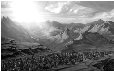
Los judíos pueden haber hecho 42 paradas distintas en el desierto, acampado en 42 lugares distintos, pero sólo uno de los viajes, el primero, los habría sacado de Egipto.