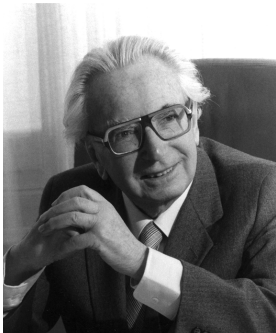
Poco después de llegar a Auschwitz, Frankl fue despojado de su posesión más preciada: un manuscrito que era el trabajo de su vida, escondido en el bolsillo de su chaqueta.