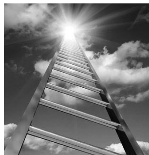
Según nuestros Sabios, la escalera que se le mostró a laakov esa noche en su fatídico sueño, la escalera que estaba "apoyada en el suelo y su extremo superior tocaba el cielo"