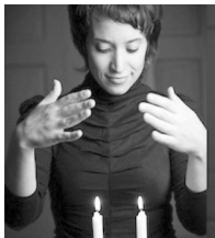
Se encienden las velas y con ambas manos la mujer agita la luz hacia ella tres veces. El simbolismo es atraer el espíritu de la santidad del Shabat hacia ella.

Después de la lectura de la Torá, se levanta el rollo mientras aún está abierto para que todos lo vean. Una vez que se lleva a cabo el acto de levantar la Torá o hagbaá, algunas comunidades tienen la costumbre de señalar la Torá con el dedo meñique, otras lo hacen mientras sostienen los tzitzit o flecos del Talit y recitan las palabras "y ésta es la Torá".