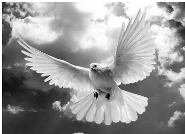
Estaban discutiendo una cierta ley sobre la preparación de alimentos en las festividades que diferencia entre una paloma que se encuentra a 50 codos (aprox. 22,86 metros) del palomar, o a más de 50 codos del nido.

Se trata de lojeved, la madre de Moshé, que nació “entre los muros