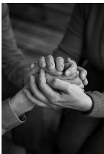
Si uno es abordado por una persona necesitada de ayuda, hay una obligación 24/7 para ayudar a nuestros hermanos en necesidad.

Lo mismo se aplicaría a colocar el dinero en una alcancía de tzedaká. El dinero dado no va al bolsillo de los pobres en esos momentos, durante las horas de la noche, así que estaría bien. Escribir un cheque, igualmente, no es problemático.