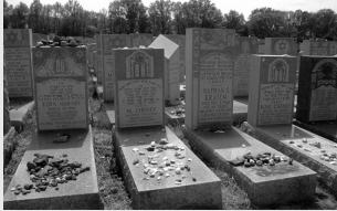
Es una antigua tradición judía comprar una parcela en el cementerio cuando uno está vivo.

El lugar de entierro comprado en un cementerio judío, a pesar de que haya sido designada para una persona, puede ser revendido. Pero el comprador debe utilizarlo únicamente para enterrar a un judío.