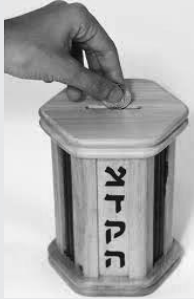
Damos Tzedaká todo el año; pero en Purim es una Mitzvá dar Tzedaká a por lo menos 2 pobres.