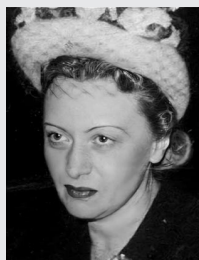
En 1988, el Rebe inauguró una “Campaña de Cumpleaños Judío” en honor a su esposa, la Rabanit Jaia Mushka, cuyo cumpleaños es el 25 de Adar.

• Reúne amigos y toma buenas decisiones. Es una excelente manera de agradecer públicamente a tu Creador por crear tu vida.