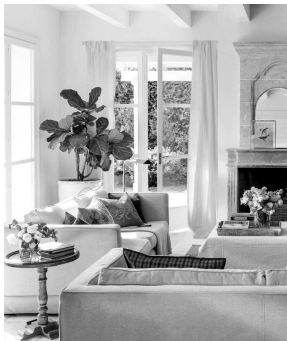
La casa, con sus paredes y su techo, brinda refugio de los elementos externos. Permite a la persona tomar el control de su entorno y darle forma.