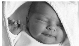
Al nacer, «un ángel toca el labio superior del niño» y este olvida. Pero, esto significa que, en lo más profundo del subconsciente de cada niño, aún existe una conciencia de toda la Torá.