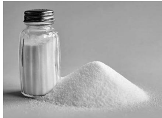
Nuestro temor al Cielo es la sal y el sabor de la "comida" de Di-s: la Torá y las Mitzvot que le servimos a diario.

Y salarás con sal cada uno de tus sacrificios de ofrenda de cereal, y no omitirás la sal del pacto de tu Di-s sobre tus ofrendas de cereal. Ofrecerás sal sobre todos tus sacrificios.