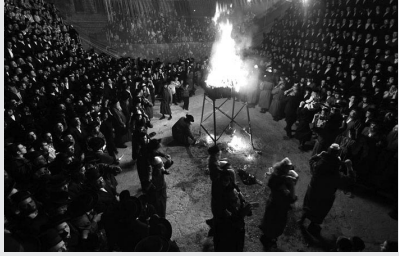
En Mirón, lugar que alberga los restos de Rabí Shimón Bar Iojai y su hijo Elazar, miles vienen de todo Israel a festejar el día con el encendido de una gran fogata y acompañada de bailes.

E l 18 de Iyar (5/5), se conmemora el día 33 de la Cuenta del Omer. En esta fecha falleció Rabí Shimón Bar Iojai, autor del Zohar, básico de la Cábala.