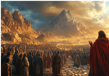
En los 3300 años de historia de nuestra nación, Di-s se ha dirigido directamente a nosotros una sola vez, cuando descendió al Monte Sinaí y entregó los Diez Mandamientos a la nación reunida.

Por lo general, solo tenemos una oportunidad para comunicar un mensaje importante.