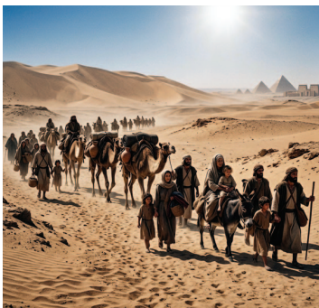
El versículo dice: «Recuerda este día en que salisteis de Egipto, la casa de esclavitud».

L a Torá se entregó el sexto día de Siván nos dice que se entregó en Shabat.