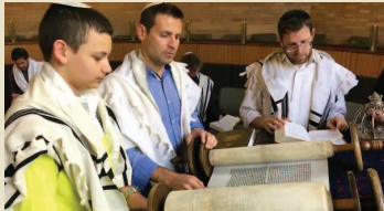
Este año, el viernes 22 de mayo, acudimos a la sinagoga para escuchar los Diez Mandamientos y reafirmar el pacto con Di-s y Su Torá.

Las almas de todos los judíos, de todos los tiempos, se unieron para escuchar los Diez Mandamientos de Di-s mismo.