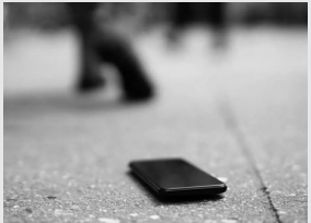
El teléfono celular se puede identificar por la foto que contiene. Y probablemente se pueda localizar al dueño de la cartera por su contenido.

Ninguna de las dos. «No dejes que el buey o la oveja de tu hermano se extravíen y los ignores; devuélvelos...» (Deuteronomio 22:1)