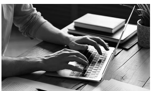
Aunque sea cierto, si dañar la reputación de alguien o causarle perjuicios económicos, puede ser problemático, aunque no tengas malas intenciones.

Hay ocasiones en que es obligatorio hacerlo.