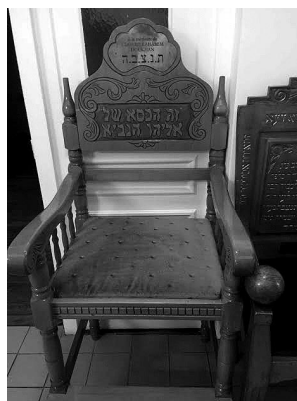
Los Sabios nos dicen que, debido a que Eliahu se quejó de que el pueblo judío no cumplía su Pacto, está presente desde siempre en cada Brit Milá, cuando un niño judío entra en el Pacto de la Circuncisión.

Él puede ver que, en efecto, el pueblo judío cumple el Pacto. Por eso, en cada Brit Milá se coloca una silla en honor al profeta Eliahu.